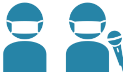
添乗員・乗務員のマスク着用