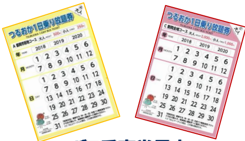
= バス乗車券見本 =