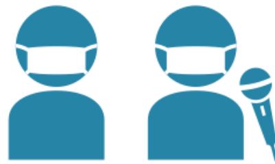
添乗員・乗務員のマスク着用