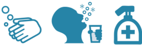
手洗い・うがい・アルコール消毒の励行