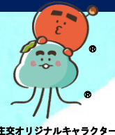
庄交オリジナルキャラクター